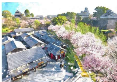
桜の馬場城彩苑整備運営事業