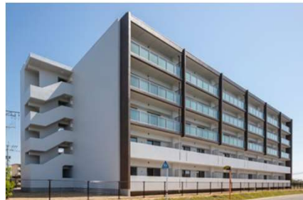
長洲町地域優良賃貸住宅整備事業