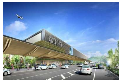
阿蘇くまもと空港コンセッション事業