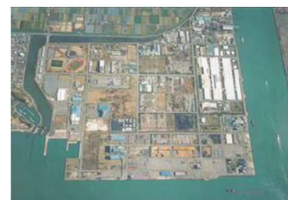
熊本県工業用水道コンセッション事業