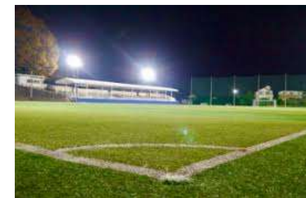
嘉島町パークPFI的的事业